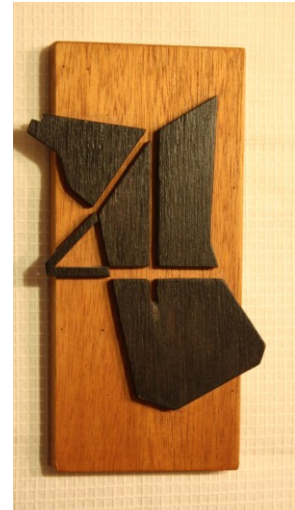
De trofee. Eenvoudig maar begerenswaardig