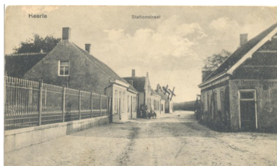
Ansicht van de Stationsstraat in Heerle

5. De Paardendreef is de oude benaming voor de Mariabaan in Wouwse Plantage.