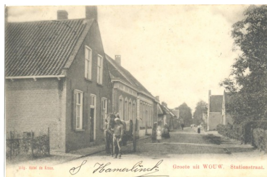
De Stationsstraat in Wouw, een deel van de huidige Bergsestraat

Mocht u het ergens niet mee eens zijn, of aanvullingen hebben, dan kunt u dat gerust laten weten op het redactieadres van de nieuwsbrief dat u in de colofon vindt.