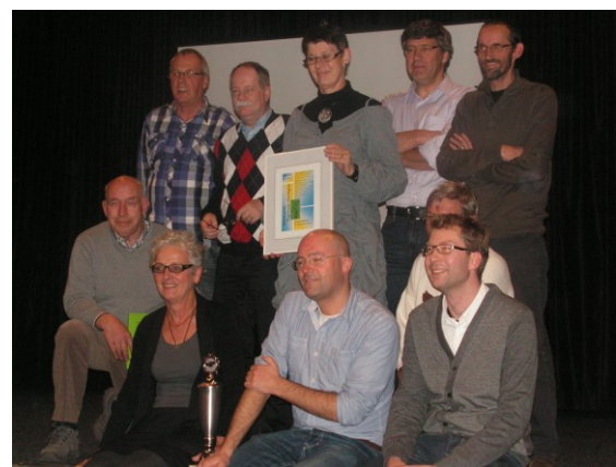
De winnende Vierschaerploeg met beker en oorkonde

‘De Honderd Hoeven’. Samen met nog zestien kringen kregen ze daar toen theorierondes te verwerken en zeven doevragen. Nieuw was dit jaar dat de joker ingezet kon worden. Daar kon de