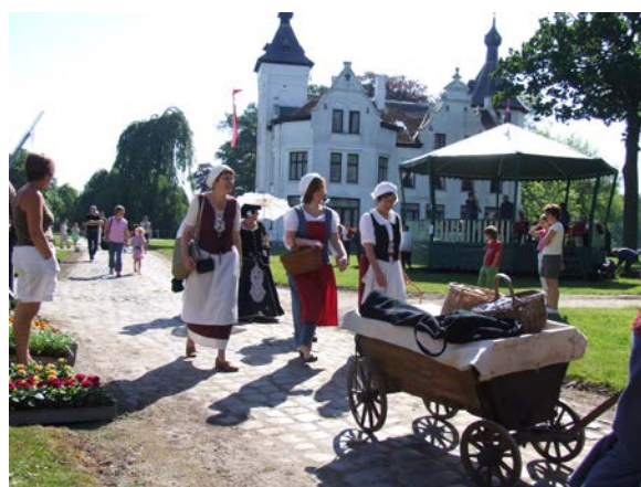
Activiteiten op het landgoed Wouwse Plantage

*4. Hkk. 'De Vierschaer': doel en activiteiten gedurende 30 jaar samenwerking met het Landgoed. Door het beschermen, in stand houden en het uitdragen van cultuur en cultuur erfgoed hopen wij dat deze dag bij de bezoekers een bijzondere indruk achter te laten, zodat zij het op hun beurt ook weer verder vertellen aan anderen, het zogenaamde ' bewaar-effect '.