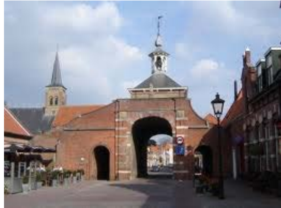
Aardenburg, de moeite van het bekijken waard!

De bus zal om 08.30 uur bij de Kapel staan en vandaaruit gaan we eerst naar Adegem . Rond 10.00 uur zijn we daar en daar krijgt U na een kop koffie een – humoristische is ons beloofd- rondleiding door de Tuinen van Adegem. Die bestaan uit een Franse rozentuin, een Engelse tuin met vijvers, een Japanse tuin en een magische Exotentuin. Verder mag U ook gratis binnenwandelen in het aangrenzende Canadamuseum. Dat is gebouwd als eerbetoon aan de Canadese