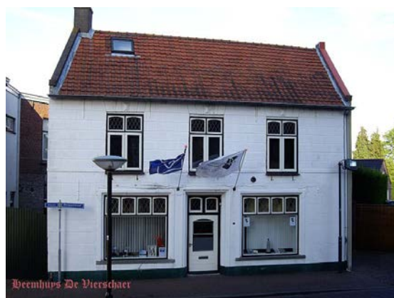
Het nieuwe Heemhuys zoals het op website van De Vierschaer te zien is

De boekenmarkt van 'De Vierschaer' tijdens de braderie van zondag 9 juni is een succes geworden. Nieuw in de presentatie