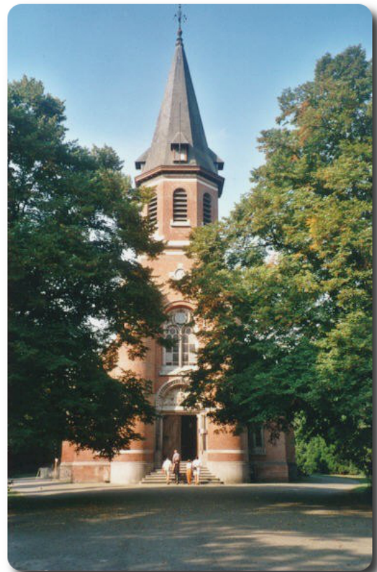
Het gevangenis museum in de Landloperkapel

Daar krijgt u onder leiding van een gids een rondleiding, waarin de geschiedenis en het gebruik