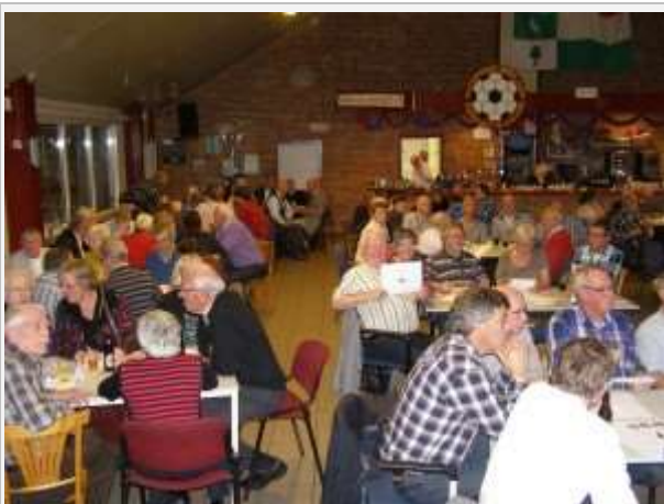
Een overzicht van de deelnemende ploegen

De teams werkten zich in het zweet om de acht rondes met theorie- en vier doevragen tot een goed einde te brengen. Nederlandse speelfilms, de geschiedenis van Oudenbosch, vaderlandse politiek, West-Brabantse zuivelfabrieken, ons koningshuis, beschermheiligen, sport, suikerfabrieken in West-Brabant en Brabantse auteurs en Brabantse zangers en zangeressen waren categorieën die elke ronde terug kwamen. Voor één van de categorieën mocht een joker ingezet worden voor dubbele punten. Bij de doevragen kwamen ANWB-paddenstoelen, boombladeren, het Oudenbosche dialect en gemeentegrenzen in beeld.